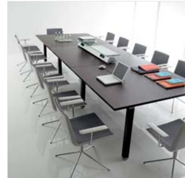
Xenon , sistema de mobiliario de oficina Diseño: Lluscà Design