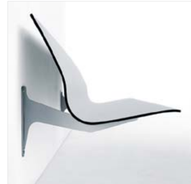
Sirimiri , colección de bancadas de uso público Diseño: King & Miranda Design