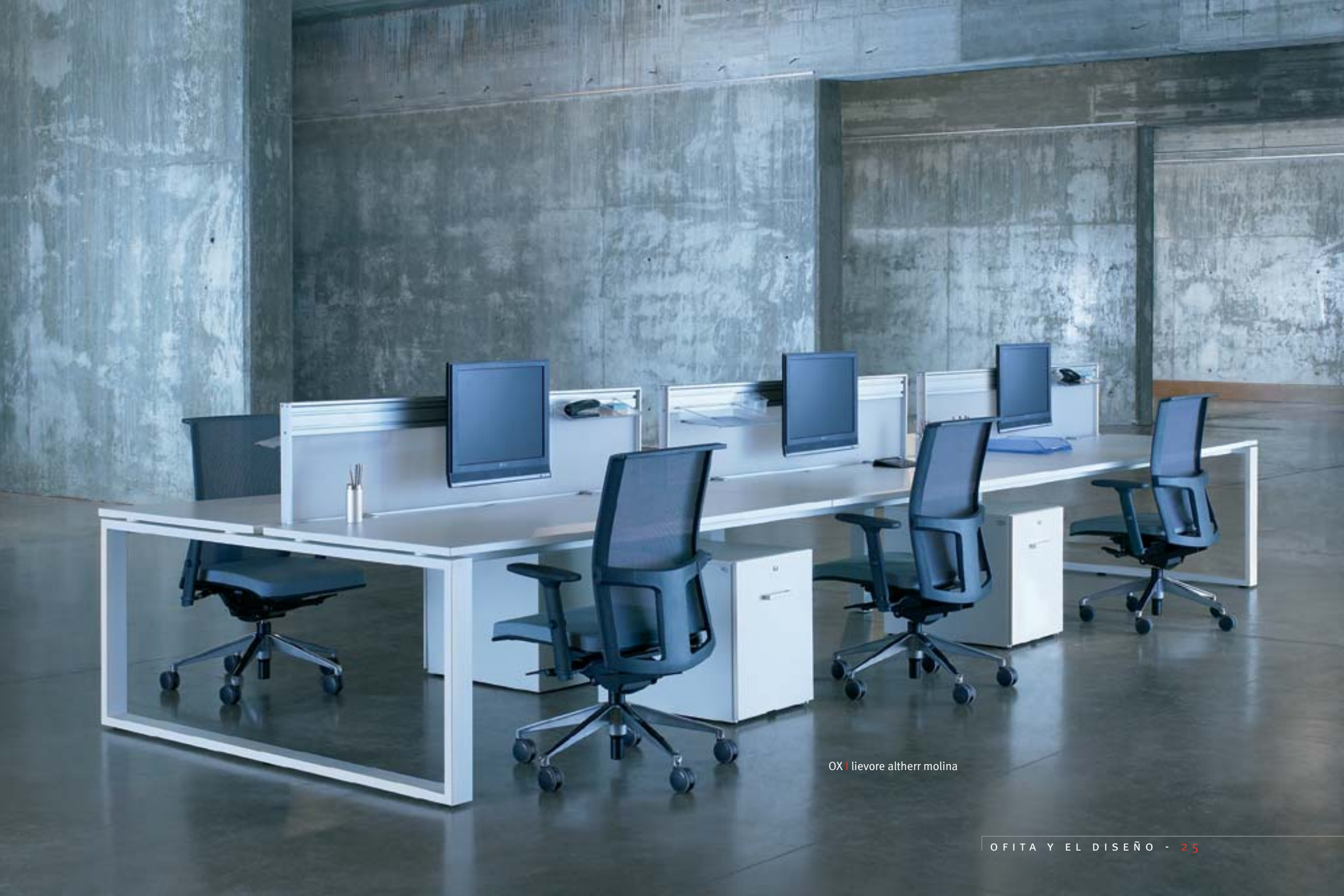
OX | lievore altherr molina