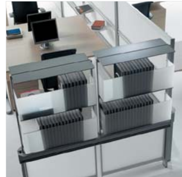
Beda, sistema operativo Diseño: Lluscà Design