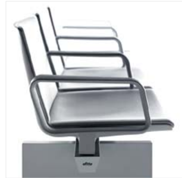
Nexa, sillería para oficina y colectividades Diseño: lievore altherr molina