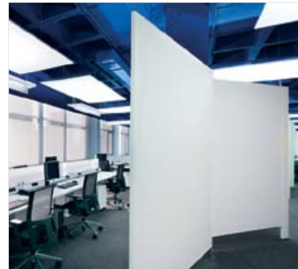
Delegación de Madrid

Las dos plantas, de 700 metros cuadrados cada una, se han articulado como espacios complementarios donde además de exponer los productos como protagonista -en el showroom- sea posible visitar un espacio de trabajo vivo -las oficinas- y descubrir la interacción entre personas y grupos en un espacio físico.