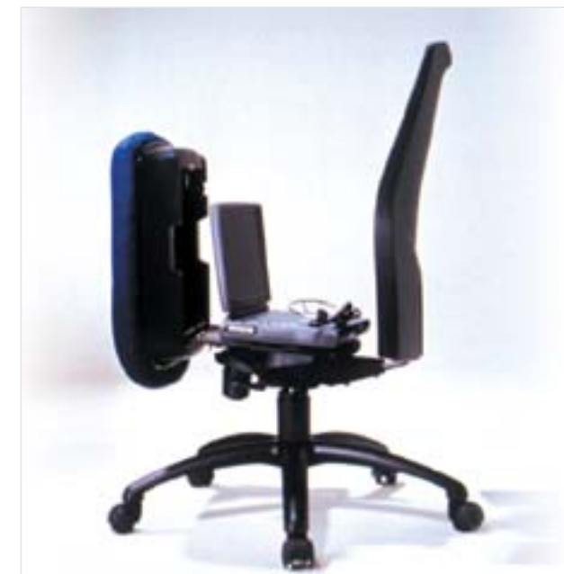
Silla para guardar el portátil (1999)

personales, y una silla en cuyo interior el usuario guarda su ordenador portátil.