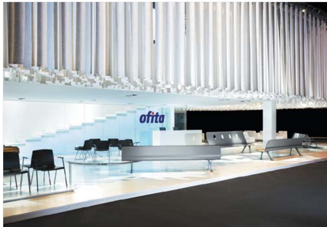
Ofitec, Madrid 2008