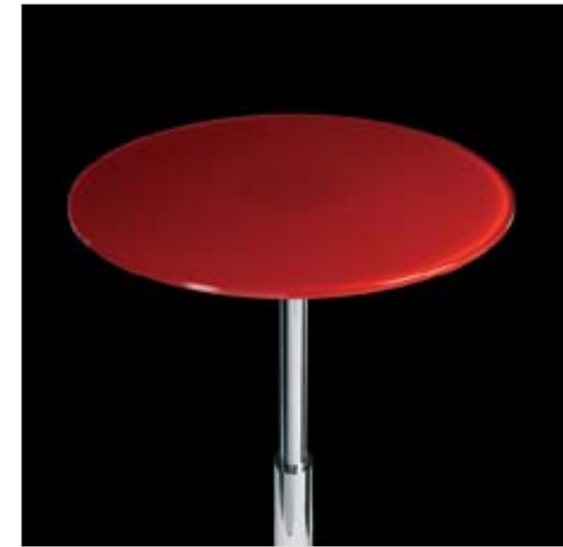
Atria , colección de mesas para los espacios de restauración y ocio Diseño: Ofita Design