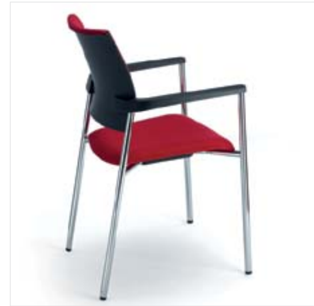
Dhara, silla operativa Diseño: Lluscà Design