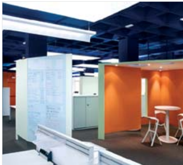
Delegación de Madrid

Recientemente, el estudio King & Miranda Design ha diseñado el showroom y las oficinas de Ofita en Madrid. Se ha efectuado un proyecto de interiorismo integral que parte de la premisa de adaptar las instalaciones de Ofita a su nueva imagen corporativa y a la aproximación actual de la empresa por el diseño, la tendencia y la cultura del proyecto.