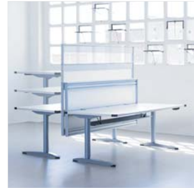
Xenon Universal , mobiliario de oficina universal Diseño: Lluscà Design