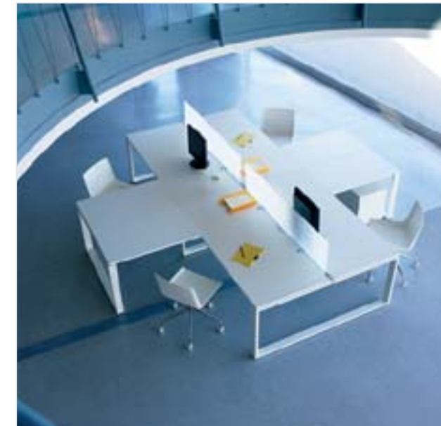
OX , sistema operativo oficina Diseño: lievore altherr molina