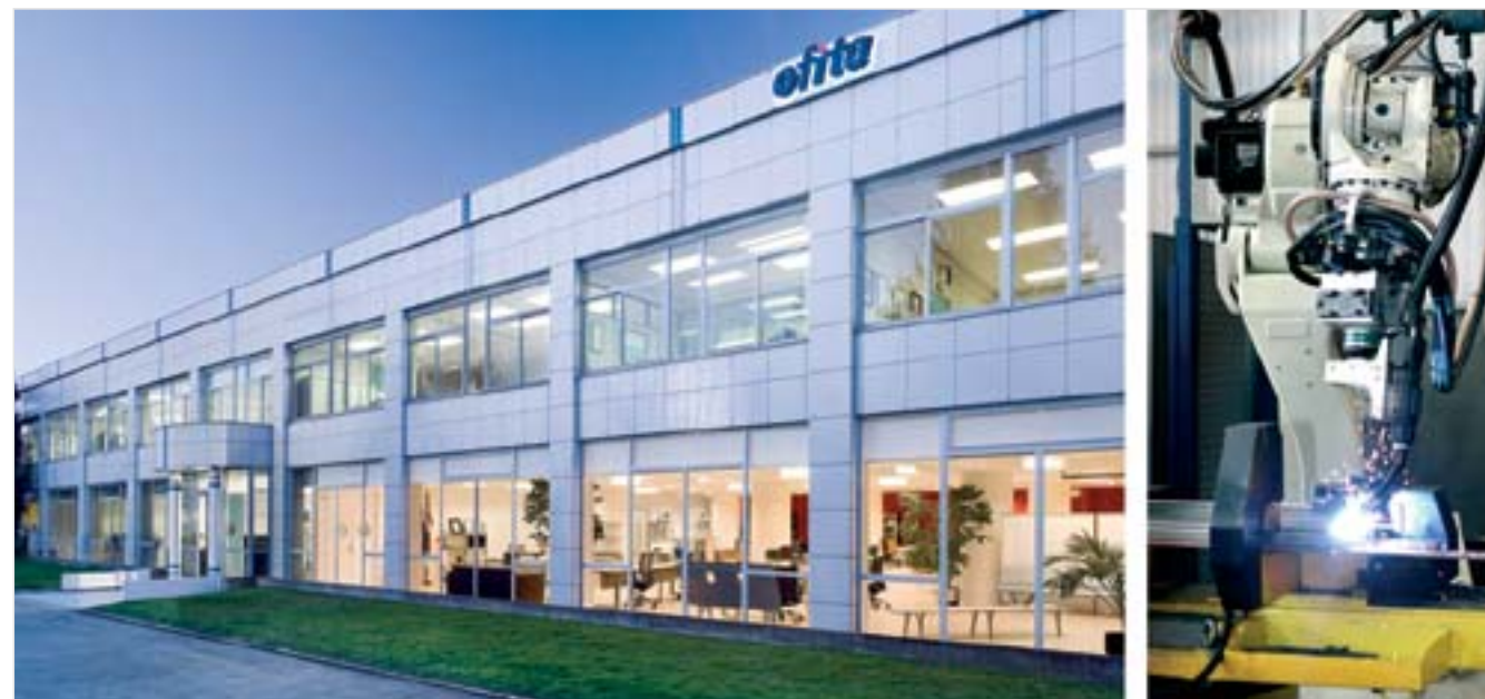
Planta Industrial, Vitoria

Dispone además de ocho delegaciones propias, con showrooms para la exposición permanente de producto, ubicadas en: A Coruña, Barcelona, Bilbao, Madrid, Málaga, Sevilla, Vitoria y Zaragoza.