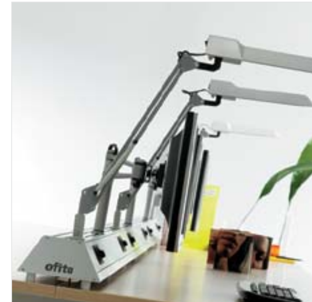
Xenon Múltiple , sistema de mobiliario de oficina Diseño: Lluscà Design