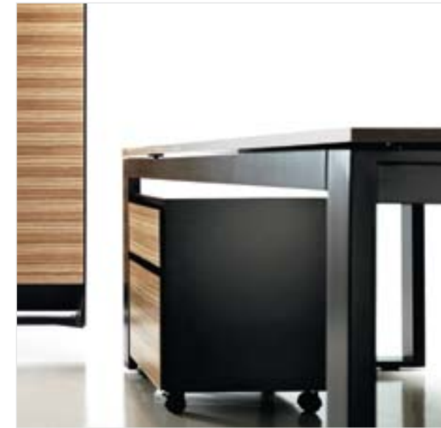
Equis, despacho de dirección Diseño: lievore altherr molina