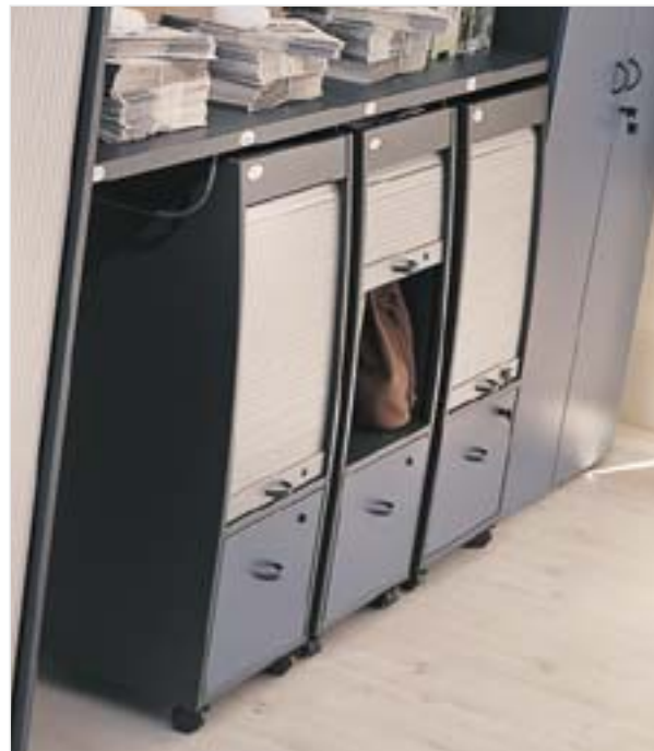
Parking para archivos en oficina no territorial (1999)

Poco después, Ofita diseña y desarrolla mobiliario específico para los espacios de trabajo en equipo, que con el tiempo se convertirían en la tendencia predominante. Nace entonces en Ofita el concepto de mesa multiusuario y multifunción, fácilmente transformable para múltiples usos o variable número de usuarios.