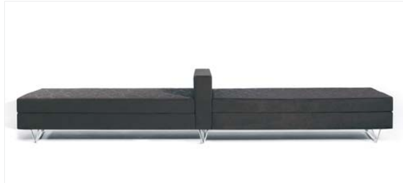
Mizar, colección de sofás y butacas Diseño: Aitor García de Vicuña