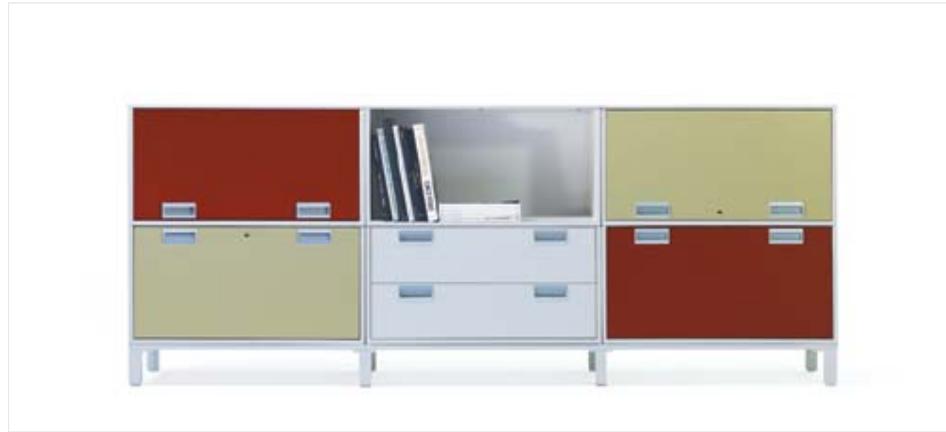
Chess, sistema de archivo y división de espacios Diseño: Ofita Design