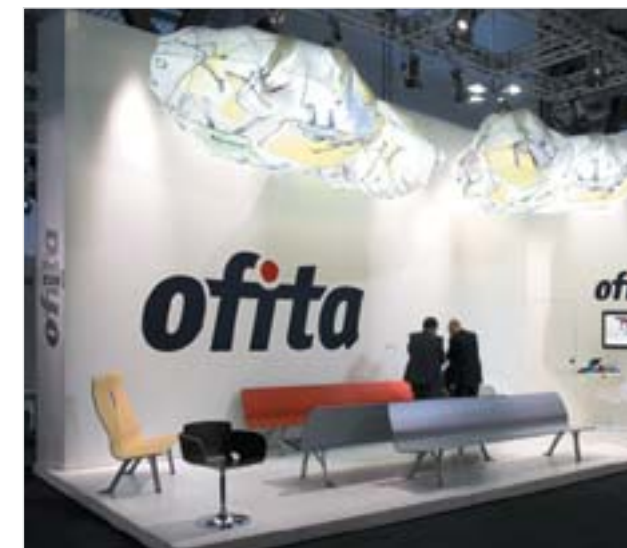
Salone Internazionale del Mobile de Milano/Ufficio. 2008.