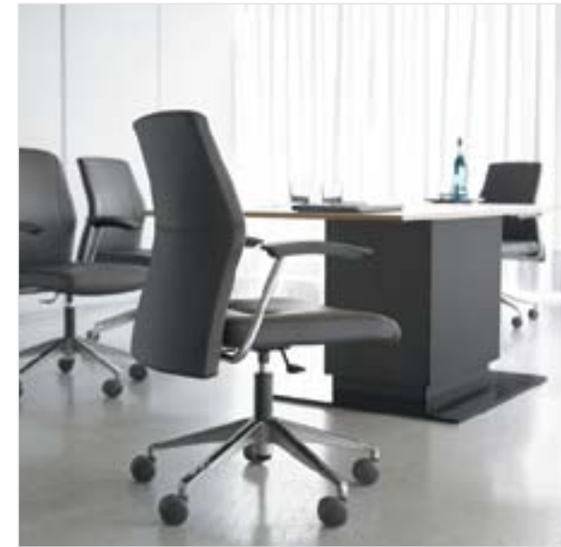
Electa neo, silla de dirección Diseño: Ofita Design