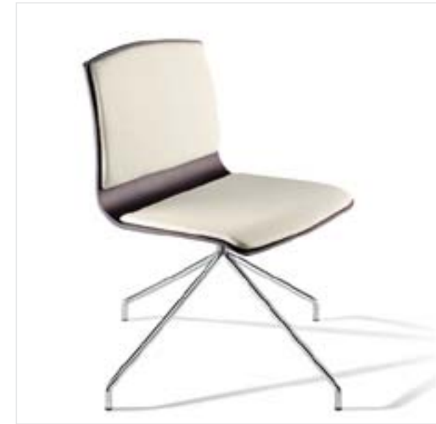
Itaida , silla para el canal contract Diseño: Aitor García de Vicuña